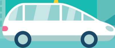
VSL* ou TAXI CONVENTIONNÉ