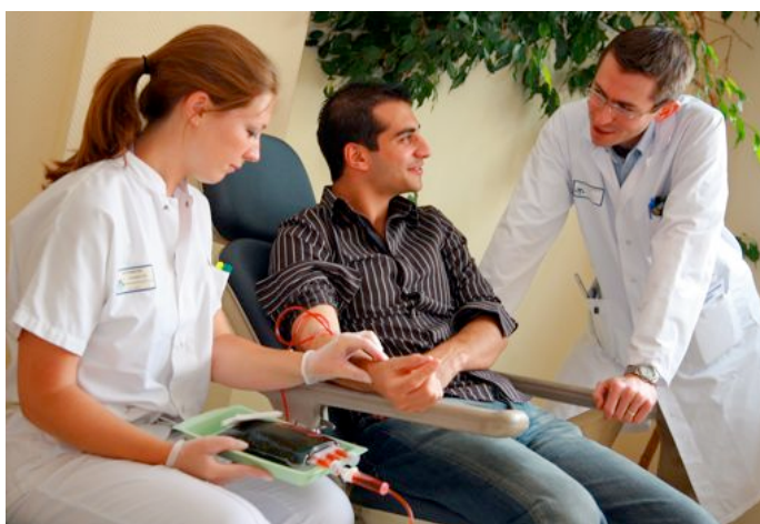
Réalisation d'une saignée